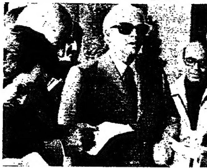
الرئيس شمعون بجلي بصحبة الى الصحفيين